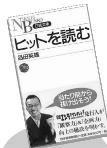
著書「ヒットを読む」 (日経文庫、2005年11月)

現在、日経MJにて『ヒットの現象学』を連載。著書に『ヒットを読む』(日本経済新聞社 日経文庫)ほかがある。日本テレビ「PON!」に水曜レギュラーとして出演中。これまでに経済産業省「映像プロデューサー人材育成支援事業委員会」委員、国土交通省「東京圏における国際文化拠点整備委員会」委員等を努めた。